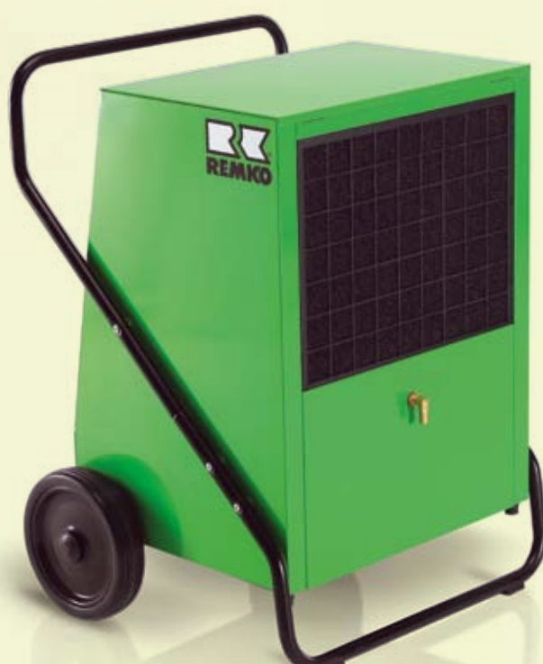
REMKO AMT 110-E