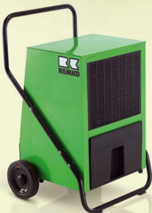
REMKO AMT 80-E