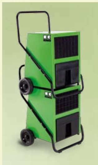
Les déshumidificateurs REMKO peuvent être empilés

Les déshumidificateurs mobiles REMKO AMT sont faciles à utiliser et garantissent un fonctionnement en continu impeccable 24 heures sur 24.