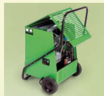
Montage convivial de l'unité