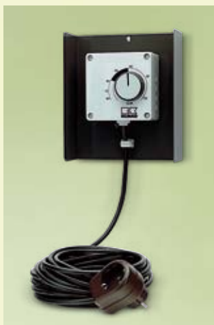
Hygrostat ambiant REMKO, Type HR-1, pour commande entièrement automatique, prêt à brancher

Les déshumidificateurs REMKO constituent un choix idéal pour le séchage économique de locaux à la cave, la pièce de bricolage, le jardin d'hiver, la salle de bain, l'atelier, la salle de loisirs, les archives, les entrepôts, etc.