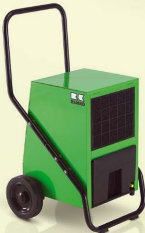
REMKO AMT 40-E