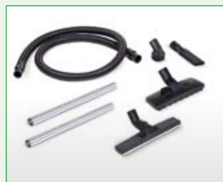
Im Lieferumfang enthaltenes Zubehör für RK 45