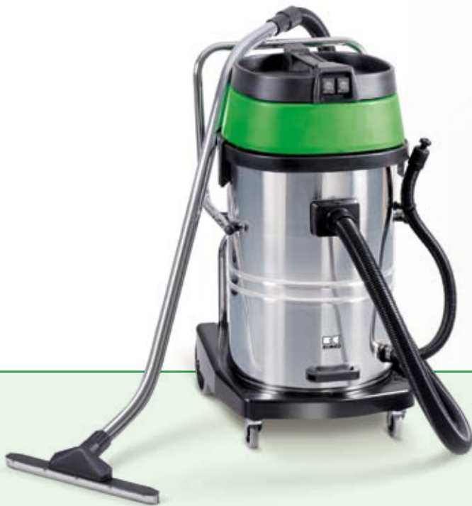
REMKO RK 75 Trocken- und Wassersauger Behälterinhalt 60 Liter

Die vielseitigen Trocken- und Wassersauger schlucken Schmutz und Wasser