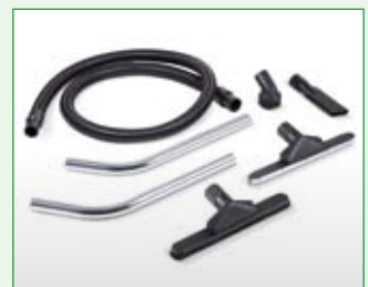
Im Lieferumfang enthaltenes Zubehör für RK 55 und RK 75