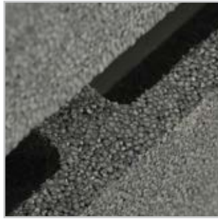
EPP-Polypropylen hat effektive Dämmeigenschaften