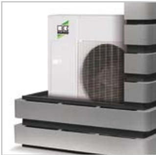
Schallreduktion von bis zu 15 dB(A)